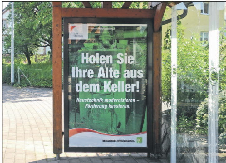
„Klimaschutz einfach machen“: Seit Dezember 2013 läuft die Offenburger Kampagne unter anderem mit frechen Plakatmotiven.